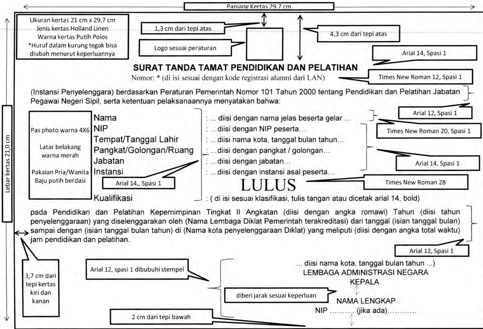
Formulir 11: Format STPP Diklat Kepemimpinan Tingkat II (halaman depan)